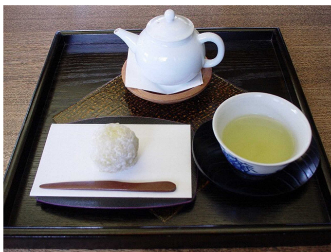
<昨年の新茶呈茶セット>