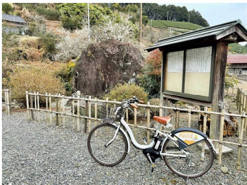
<狐石と刻まれた文章についての掲示>

所在地:静岡県静岡市葵区足久保奥組(しずてつジャストライン 美和大谷線・奥長島行き「長島」バス停より徒歩 3 分)